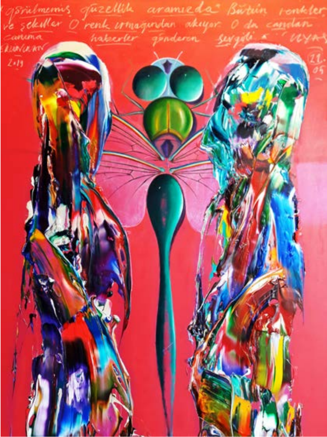
Ergin İnan, 2019 Tuval üzerine karışık teknik 180 x 140 cm