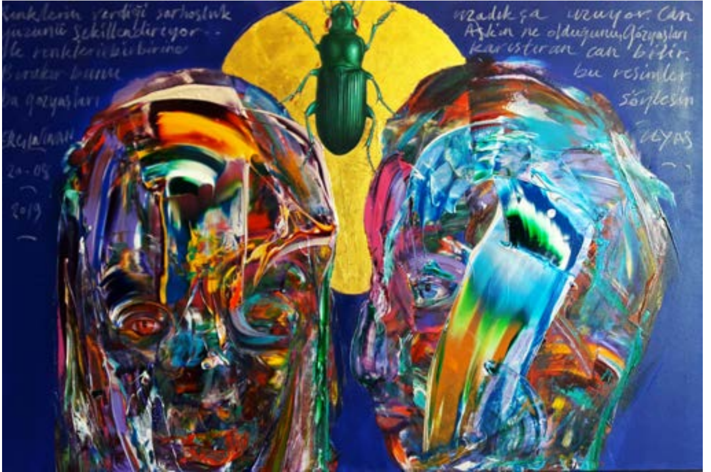
Ergin İnan, 2019 Tuval üzerine karışık teknik 100 x 150 cm