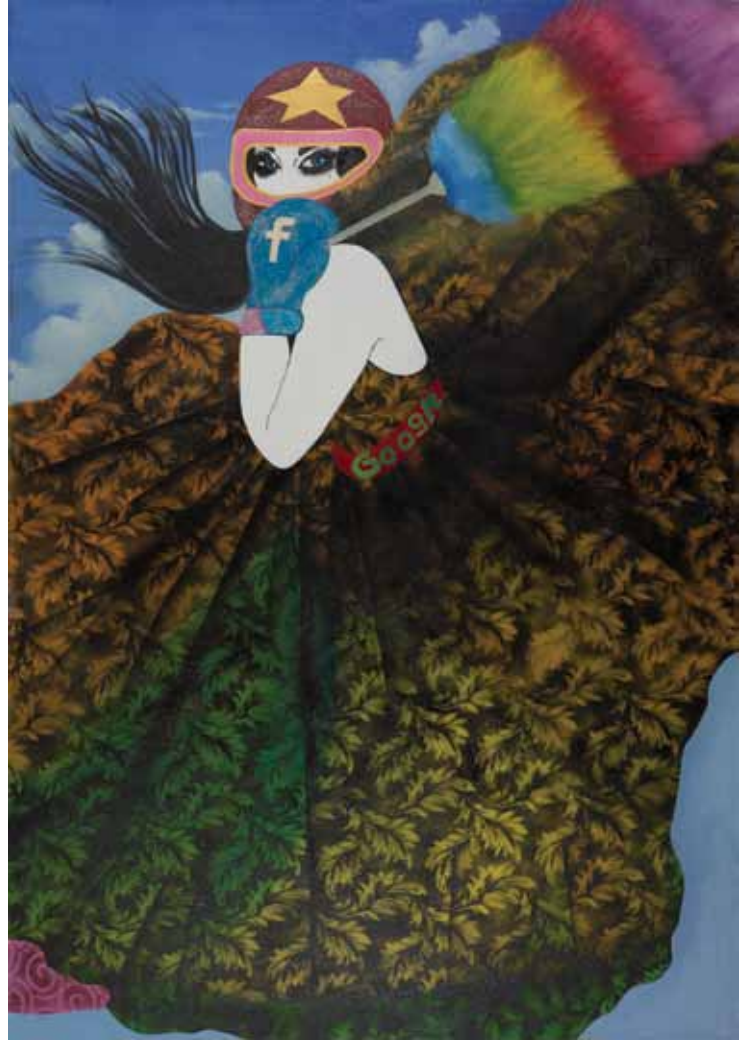
Ayıbımı örttüm I smoothed over my cracks Tuval üzerine karışık teknik (diptik) Mixed media on canvas (diptich) 140 x 110 cm - 220 x 140 cm / 2012