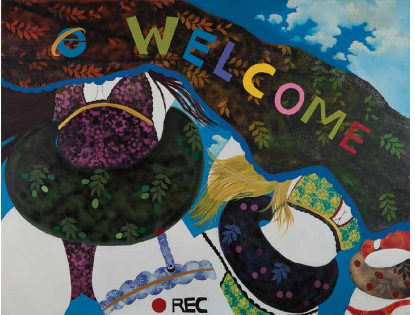
Hoşgeldiniz Welcome Tuval üzerine karışık teknik Mixed media on canvas 170 x 220 cm / 2012