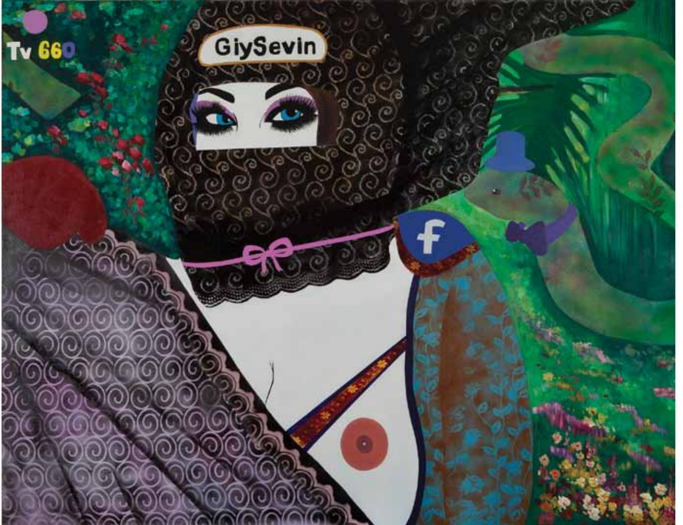
Giy Sevin Wear-and-Enjoy Tuval üzerine karışık teknik Mixed media on canvas 170 x 220 cm / 2012