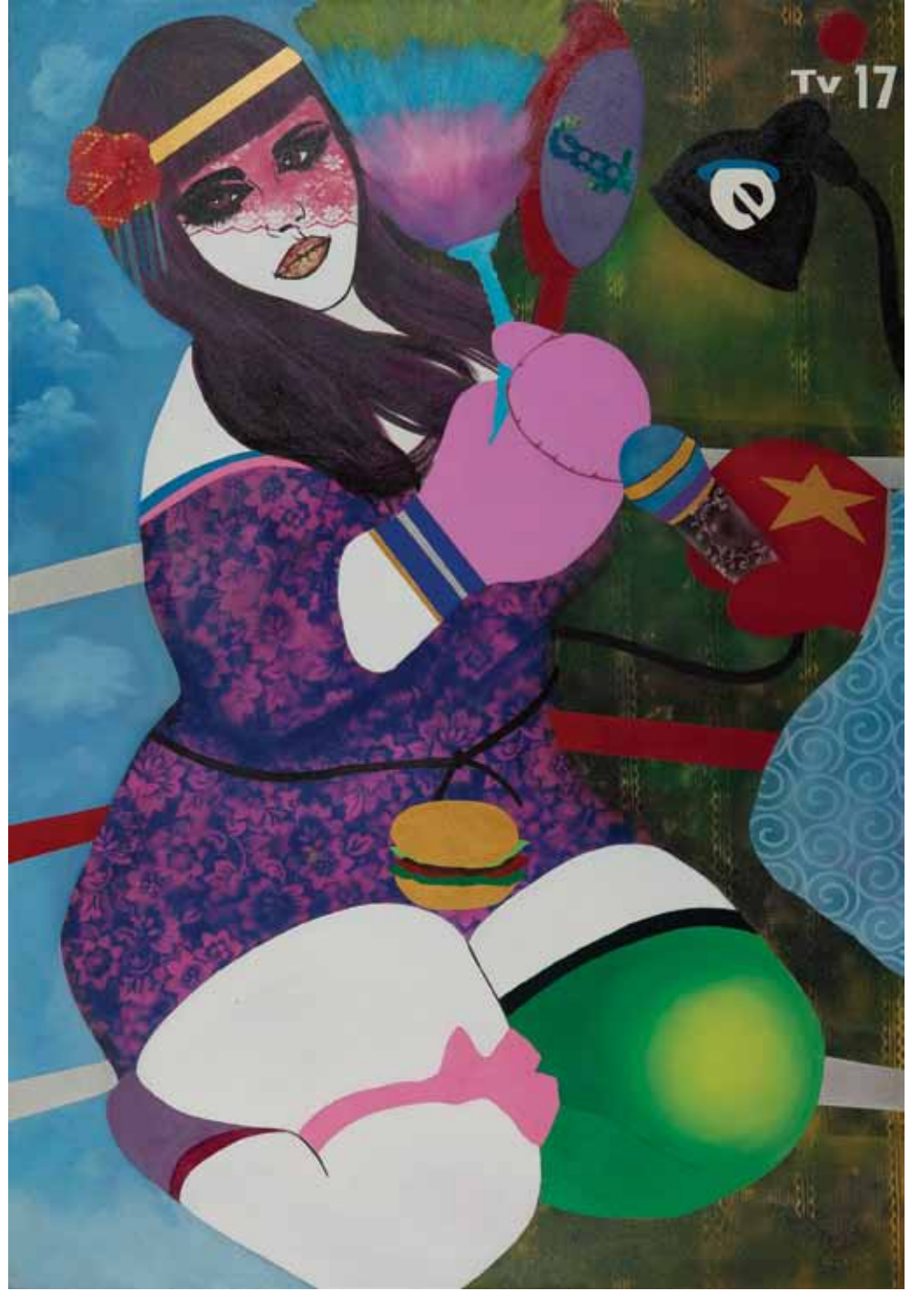
Yer misin? Do you eat? Tuval üzerine karışık teknik Mixed media on canvas 200 x 140 cm / 2012