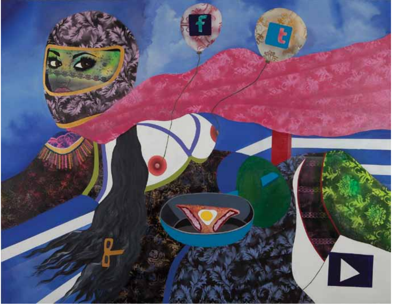
Ya patlarsa? What if it explodes? Tuval üzerine karışık teknik Mixed media on canvas 170 x 220 cm / 2012