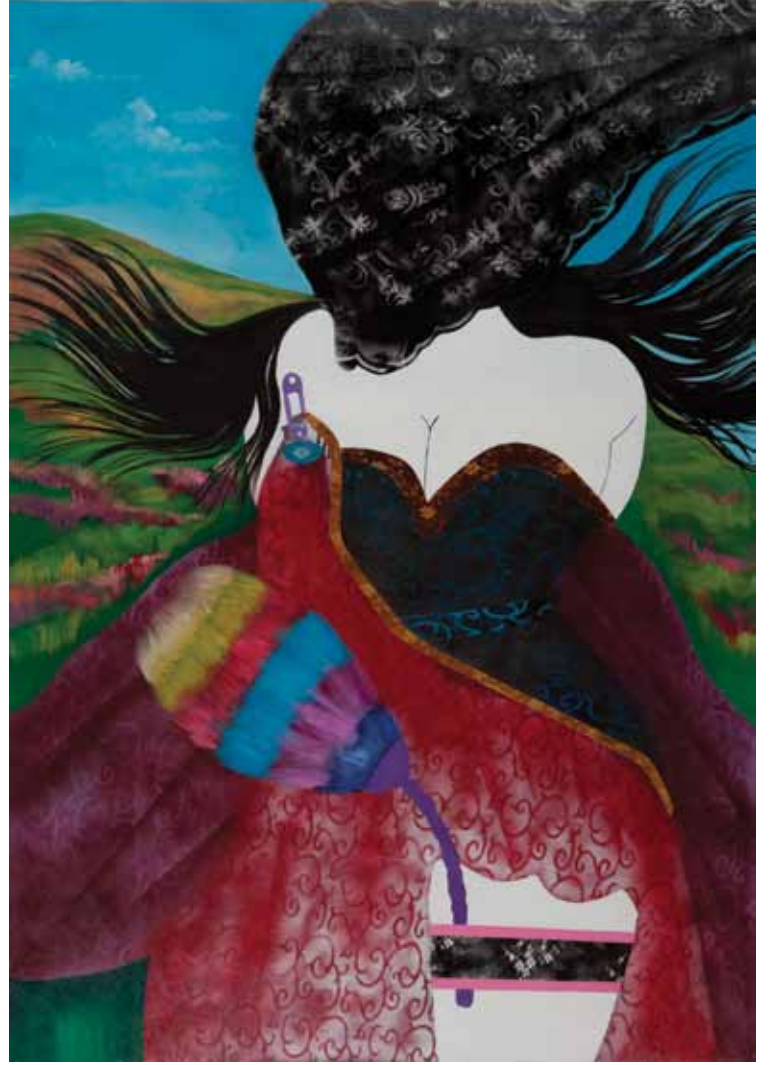
Son Piknik Yemeđi The Last Picnic Meal Tuval üzerine karışık teknik (diptik) Mixed media on canvas (diptich) 140 x 110 cm - 220 x 140 cm / 2012