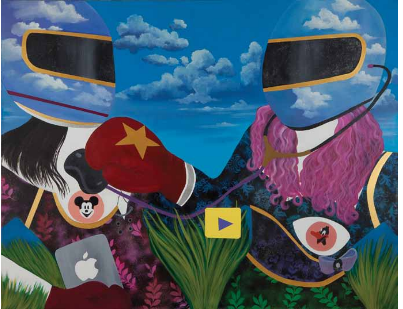
Teknoloji Doktoru Doctor of Technology Tuval üzerine karışık teknik Mixed media on canvas 170 x 220 cm / 2012