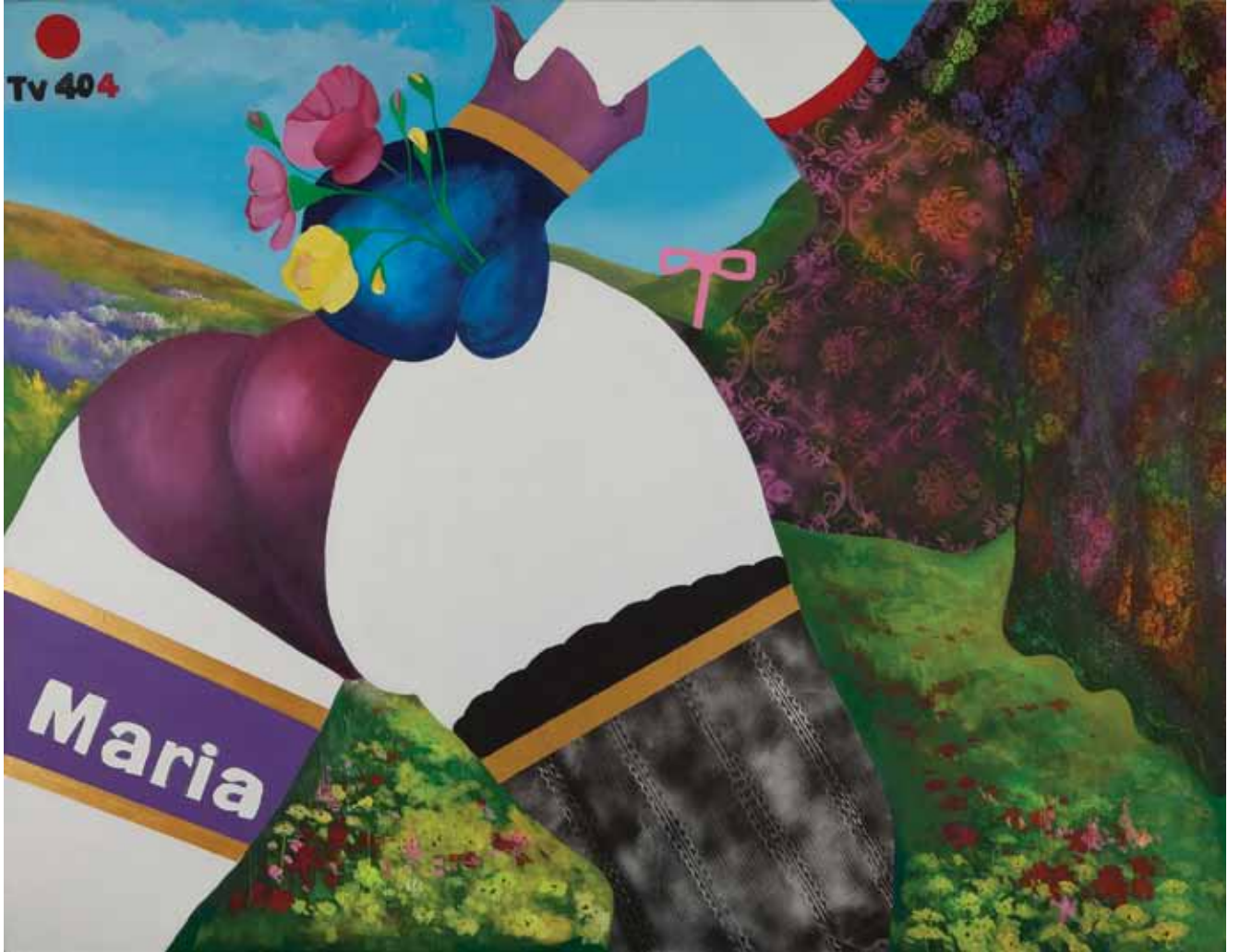
Maria Maria Tuval üzerine karışık teknik Mixed media on canvas 170 x 220 cm / 2012