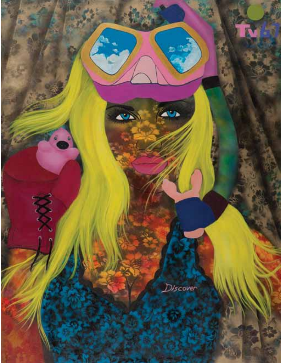
Keşfetmek Discover Tuval üzerine karışık teknik Mixed media on canvas 175 x 135 cm / 2012