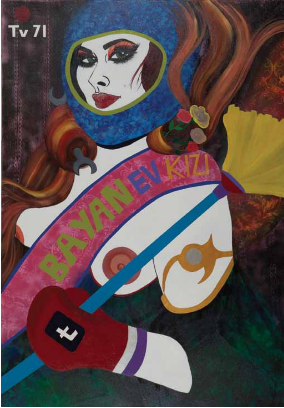
Bayan Ev Kızı Miss Housewife Tuval üzerine karışık teknik Mixed media on canvas 220 x 140 cm / 2012