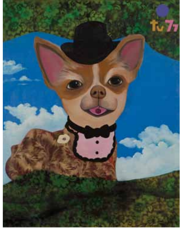
Süpürürüm sizi I sweep you away Tuval üzerine karışık teknik (diptik) Mixed media on canvas (diptich) 220 x 140 - 140 x 110 cm / 2012