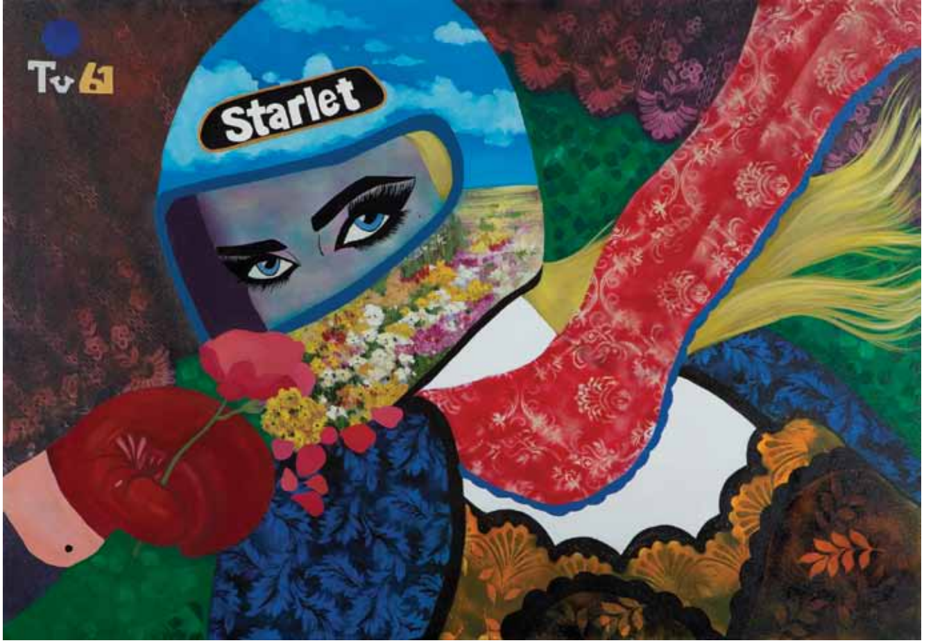
Starlet Starlet Tuval üzerine karışık teknik Mixed media on canvas 170 x 220 cm / 2012