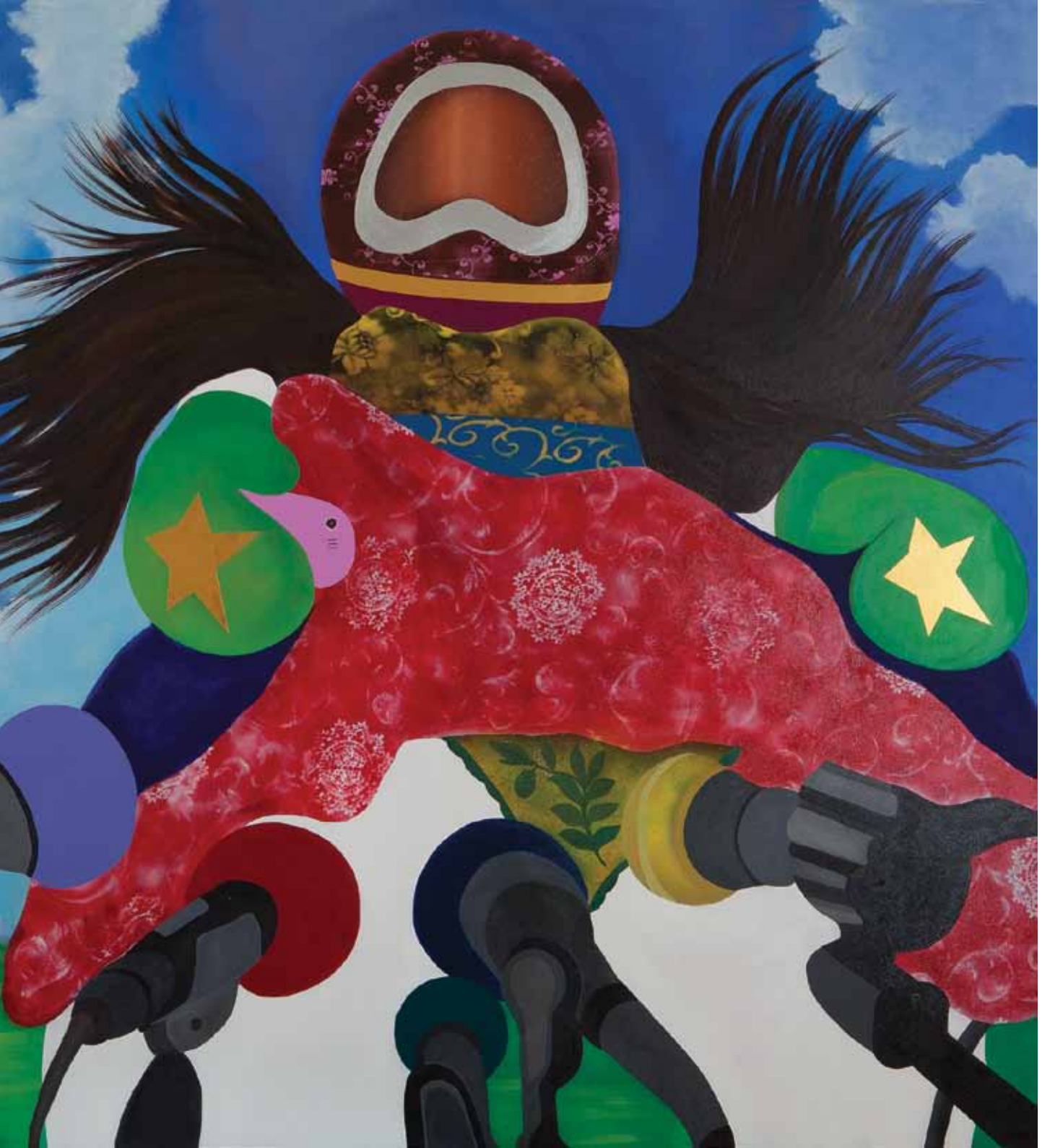
Dünya barışı hakkında ne düşünüyorsunuz? What do you think about the peace in the world? Tuval üzerine karışık teknik Mixed media on canvas 170 x 220 cm / 2012