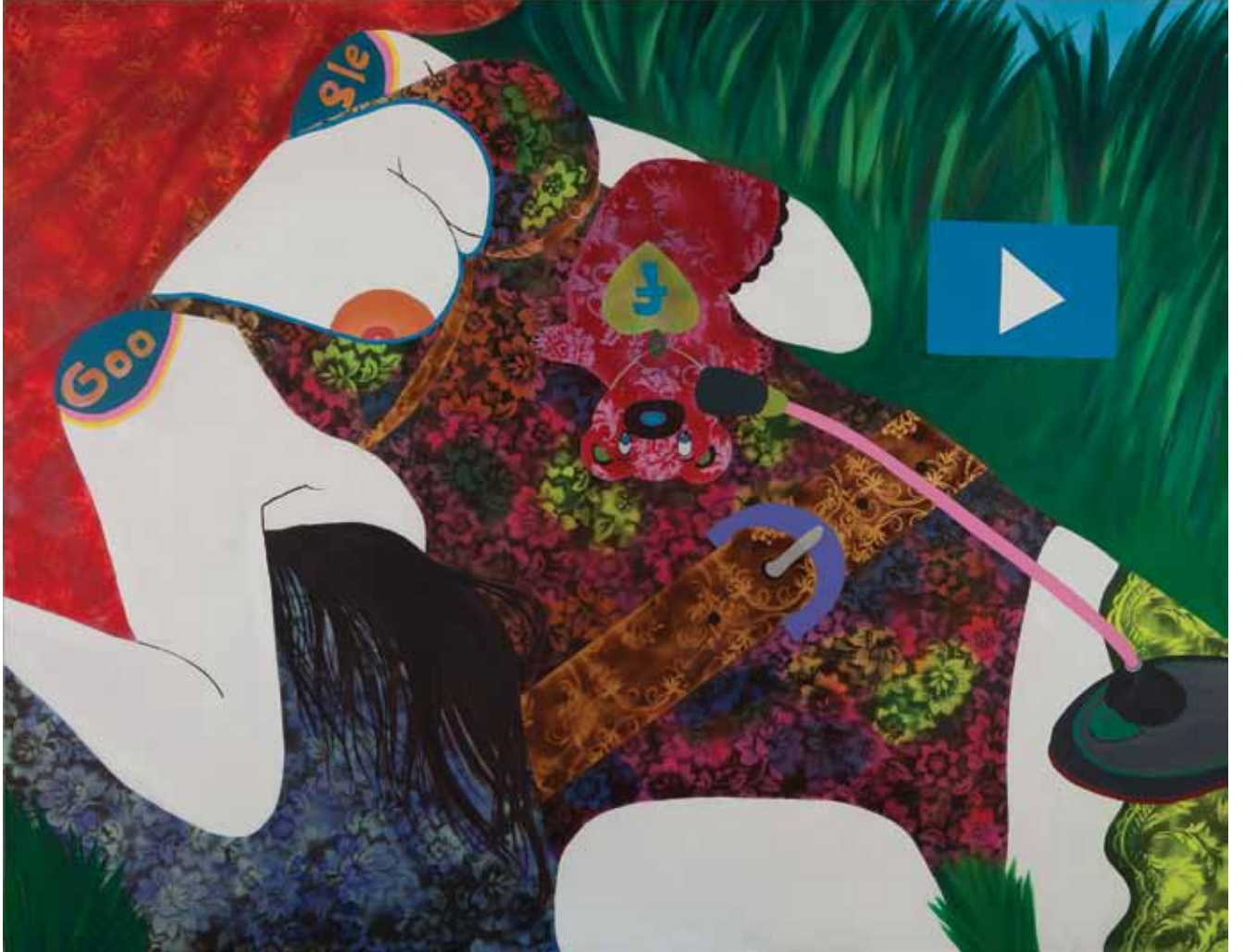
Moda Geçici, Stil Kalıcı Fashion is Temporal, Style is Permanent Tuval üzerine karışık teknik Mixed media on canvas 170 x 220 cm / 2012