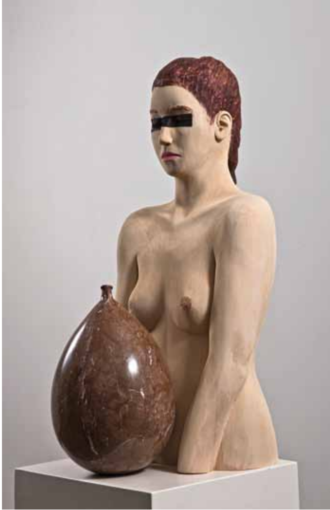
Bozgun / Defeat Ahşap ve mermer / Wood and marble 73 x 33 x 39 cm / 2013