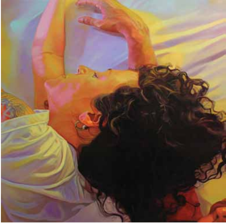
İsimsiz / Untitled Tuval üzerine yağlıboya / Oil on canvas 137 x 132 cm / 2013