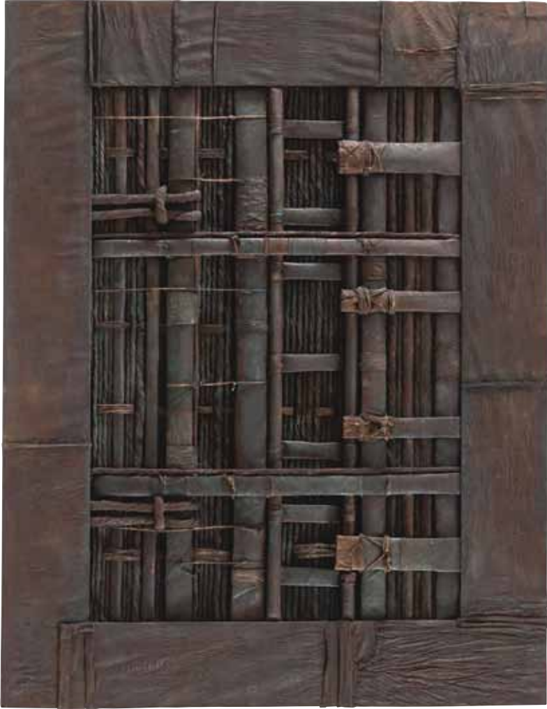
Dikdörtgen Serisi / Oblong Series Karışık teknik / Mixed media 167 x 126 x 9 cm / 2012